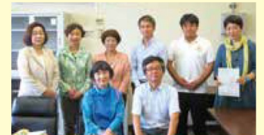
それぞれ考え方の違う会派ですが、何度も協議を重ね、一致したところを修正案としてまとめました