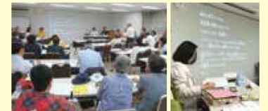
6月2日の市民との意見交換会は25名の市民等が参加。喋ったことが文字化されるアプリ「UDトーク」と手話通訳を手配し、ここで出された意見も修正協議に反映