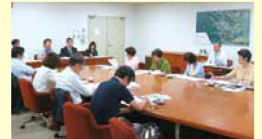
八王子市の条例策定とその後の取組について視察