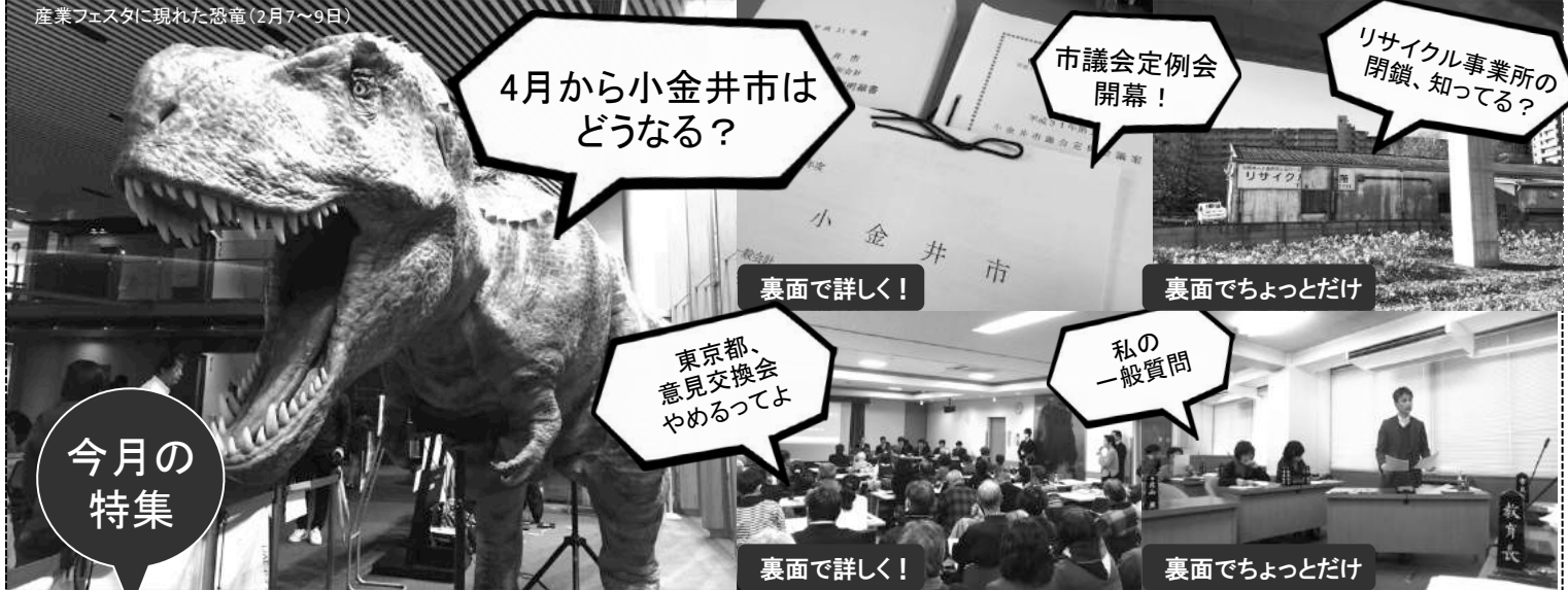
産業フェスタに現れた恐竜(2月7~9日)