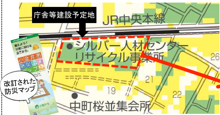
(引用) 小金井市HP 防災マップ

今年度実施設計、来年度から着工へ向かうスケジュールで進捗している新庁舎&福祉会館建設ですが、また新たな課題が発覚しました。国の想定降雨量の更新に伴い防災マップの「浸水予想区域図」が改訂され、庁舎等建設予定地の大部分が1m(1階の床までつかう程度)の浸水予想区域に指定されました。新庁舎&福祉会館は大規模災害時の拠点となる施設であるため、何らかの対応を施さなければなりません、11月19日の特別委員会でもまだ「対応協議中」「実施設計期間を延ばす可能性」にも言及されています。