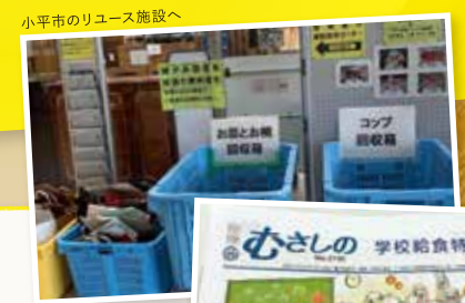
武蔵野市の学校給食の体制について

コロナの影響で対面での研修や行政視察が難しい中でも、オンラインも活用しながら勉強会や視察等にのべ100回以上参加し、積極的に学び続けています。